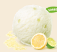
LEMON & LIME